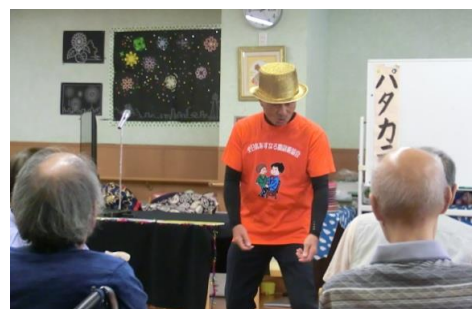
腹話術の演技全景