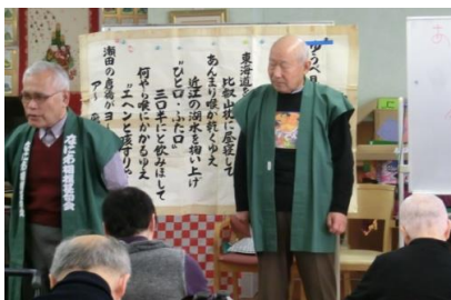
相撲甚句の演技風景