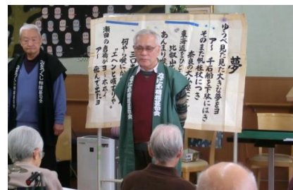
マジック演技風景