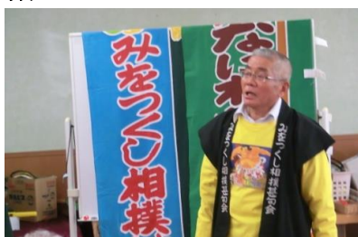
三味線で弾き語り風景