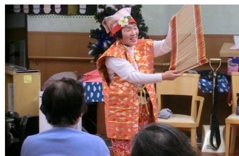
南京玉すだれの演技風