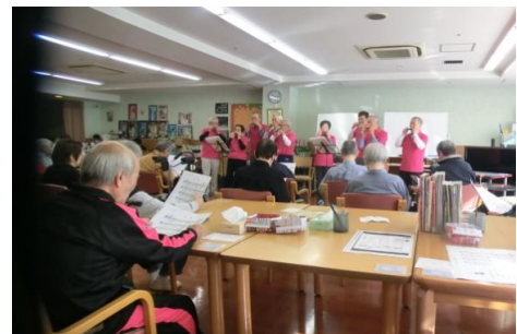
腹話術の演技全景