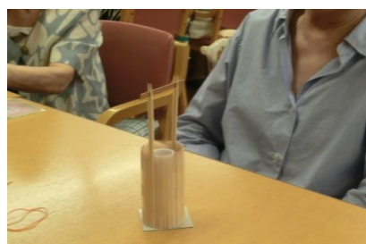
作業完成のおもちゃ作り