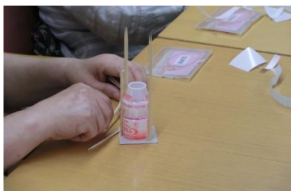
作ったおもちゃで楽しんでいる様子