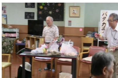
おもちゃ作りの説明