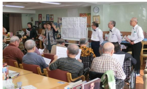
参加者と司会者の掛け合い